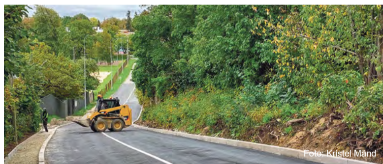
Silla tänava ehitus.