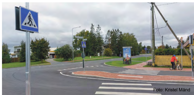
Fr. R. Kreutzwaldi tänava ristmik.