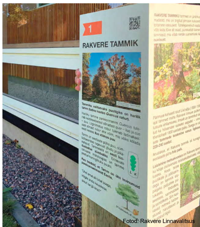
Tammiku õpperaja äärde paigaldatakse uued infopostid.

Projekti tegevusi rahastatakse SA Keskkonnainvesteeringute Keskus looduskaitse infrastruktuuri arendamise alamprogrammi kaudu ja Rakvere linna omafinantseeringuga linna eelarvest.