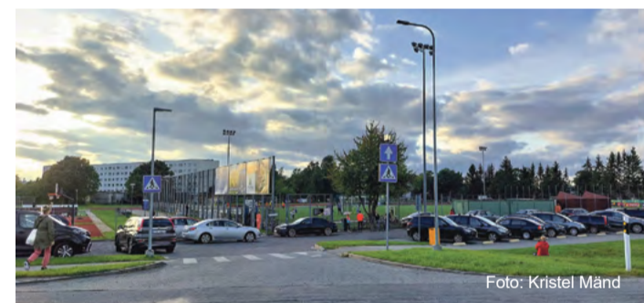
Staadioniga piirneval lõigul muutus liiklus ühesuunaliseks.

Uuel tänaval, Mulla ja Tuleviku tänava vahelisel kunstmuru-staadioniga piirneval lõigul muutus senine kahe-suunaline liiklus ühesuunaliseks, sõidusuunaga Tuleviku tänava poolt Mulla tänava poole. Uuel tänavalt saab endiselt sõita välja Mulla tänavale mõlemale sõidusuunale, küll aga ei saa enam Mulla tänavalt pöörata Uuele tänavale.