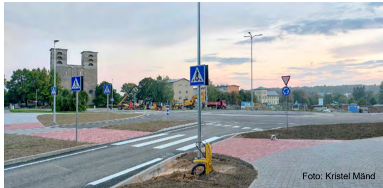
Vabaduse tänava ringi ümberehitus.