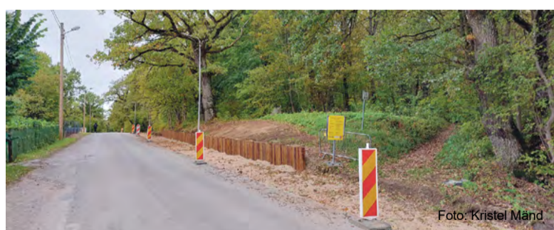
Tammiku kergliiklustee ehitus.