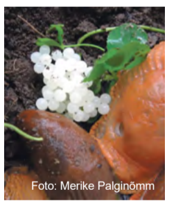
Hispaania teeteo munad.

Ära too istikuid oma aeda piirkondadest, kus leidub hispaania teetigu ja mustpeanälkjat. Kontrolli isikute mullapalle. Leitnud munad hävita keevas vees. Istikute soetamisel hoia neid mõni nädal karantiinis. Seo mullapalli ümber läbipaistev kilekott ja kinnita see tihedalt ümber istiku varre. Aeg-ajalt kontrolli, kas kilekoti sees on munadest koorunud nälkjaid. Hävita kotti sattunud isendid keeva veega.