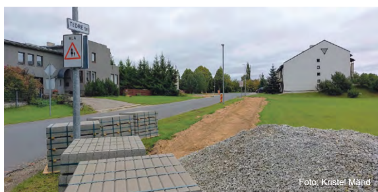
Kajaka-Tedre kõnnitee ehitus.