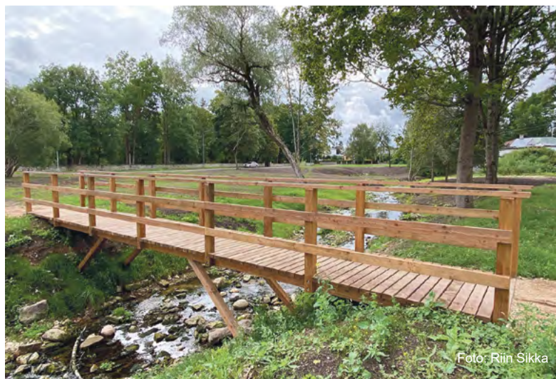
Vabriku tänava 16 sild.

Linnavalitsusel on SA Kredex lammutustoetuse abil kavas lammutada sel aastal veel Rahvaia asuv amortiseerunud käimla ja Kasarmu tänaval paiknev väike kasutuseta ehitis.