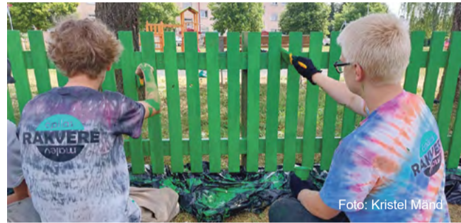
Malevlaste abiga sai Lennuki tn mänguväljaku aed värvid.