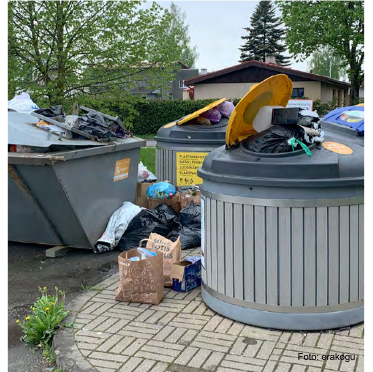
Kui pakendikonteinerisse tuuakse kõik muu peale pakendite, peab konteineri tühendamise eest tasuma linnaeelarvest.