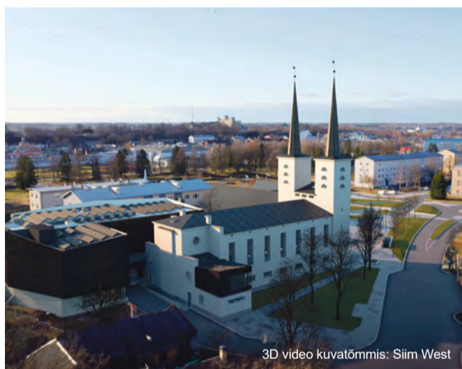
Arvo Pärdi muusikamaja eskiis.

Eesti Kultuurkapitali seaduse kohaselt toetab kultuurkapitali nõukogu vastavalt riigikogu otsusega kinnitatud pingereale riiklikult tähtsate kultuuriehitiste rajamist ja renoveerimist. Ühel ajal saab toetada kuni kahte objekti. Kultuuriehitiste rajamiseks ja renoveerimiseks eraldatakse igal aastal 60,6 protsenti kultuurkapitalile sihtotstarbeliselt laekuvast hasartmängumaksust.