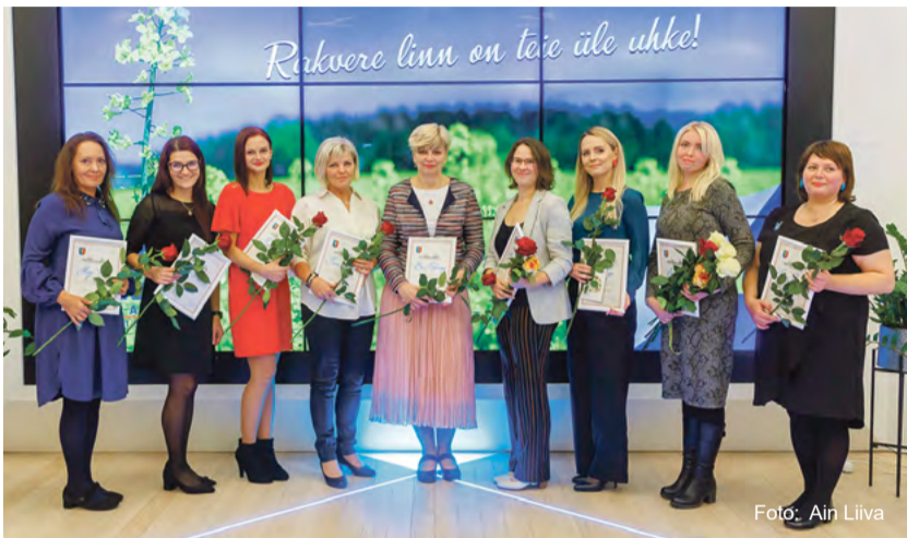
Õpetajate päeva tänuüritus.