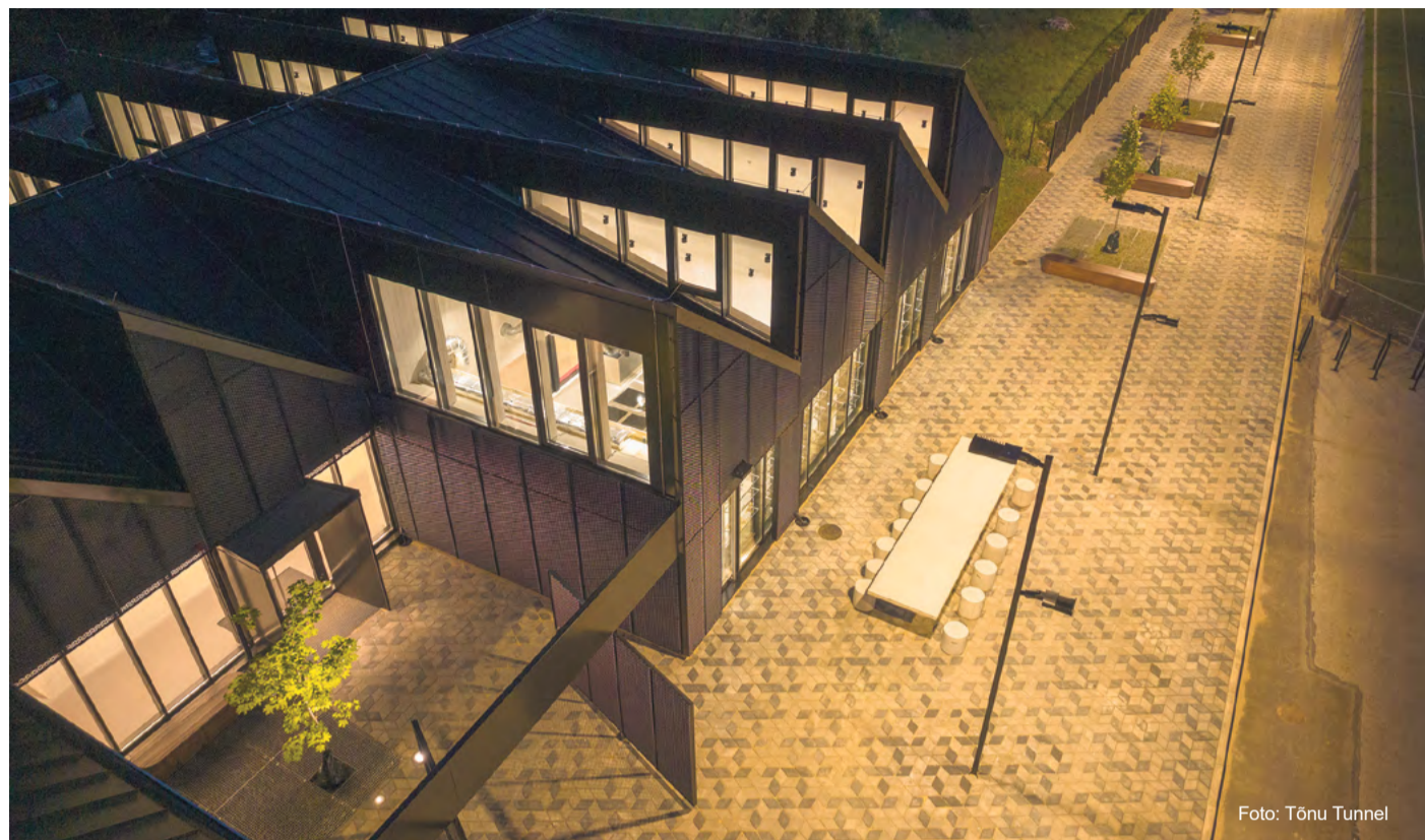
Rakvere linna põhikoolide töö- ja tehnoloogiakeskus pälvis maineka tiitli.

4. novembril kuulutati iga-aastaselt rahvusvahelisel puitarhitektuuri konverentsil välja konkursi Aasta Puitehitis 2022 võitja. Maineka tiitli pälvis Rakvere linna põhikoolide töö- ja tehnoloogiakeskus, mille puhul tõi Žürii esile puitmaterjali leidliku kasutuse ja nutikalt lahendatud projekti.