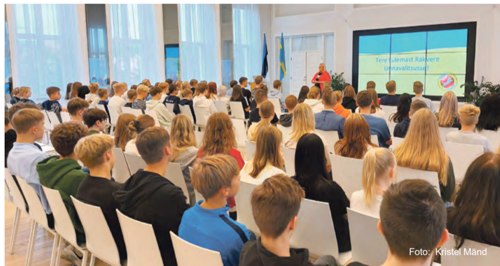
Ettevõtlusnädal Rakvere linnavalitsuses.

Igal aastal oktoobri alguses toimub kõigis 15 maakonnas suurim üle-eestiline ettevõtlussündmus ettevõtlusnädal, mille sihtrühmaks on nii täiskasvanud kui ka noored.