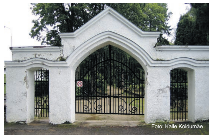
Rakvere Linnakalmistu peavärvast.

Kalle Koidumäe, telefonid: 327 7035, 5343 7770, e-post: kalle.koidumae@rakvere.ee