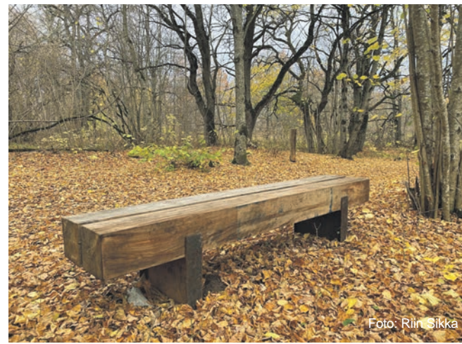
Rakvere tammiku uued pingid on.

10 801.60 euroga. Sama projekti raames valmisid ka õpperaja voldikud, mida on võimalik kaasa haarata Lai tn 20 asuvas turismiinfokeskuses.