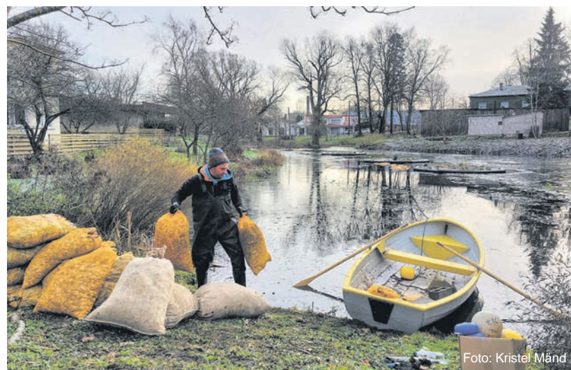
Allika pargi tiigi põhja asetati 7,5 m 3 puiduhaket, mis vett puhastavad.