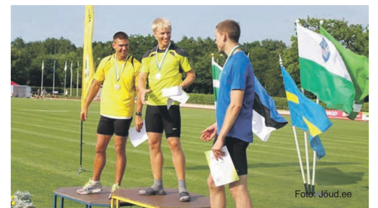
Meenutus 2011. aastal Rakveres toimunud mängudest.

16. Eestimaa suvemängud korraldab Eestimaa Spordiliit Jõud koostöös Rakvere Linnavalitsuse ja Lääne-Virumaa Spordiliiduga.