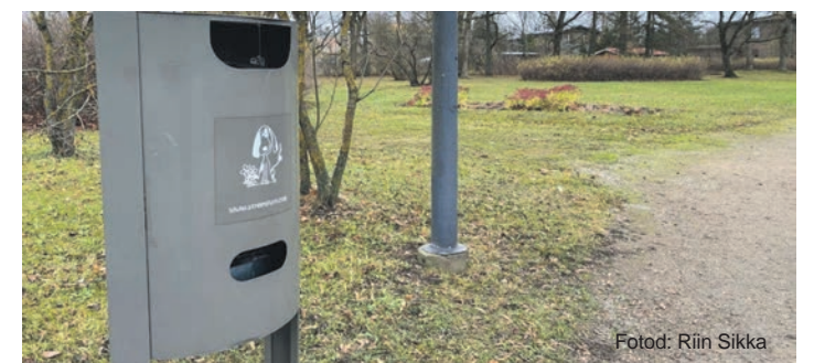
Üks hoidja on Karja ja Vabaduse tänava nurgal asuvas pargis.

Puhtas linnaruumis on kõigil meeldiv jalutada. Aitäh, et hoolite!