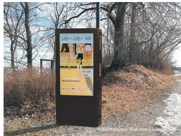
Illustratsioon: Rakvere Linnavalitsus

Kõigil, kellel on soov avaldada reklaami teenuse või ürituse kohta, mis on Rakvere linna elanikele hariv ja kasulik, palume kirjutada marju.pyumets@rakvere.ee .