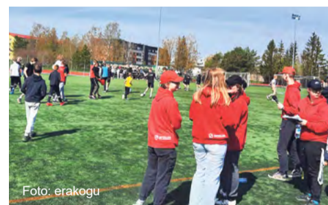
Õpilasesindus esiplaanis punastes pusades.