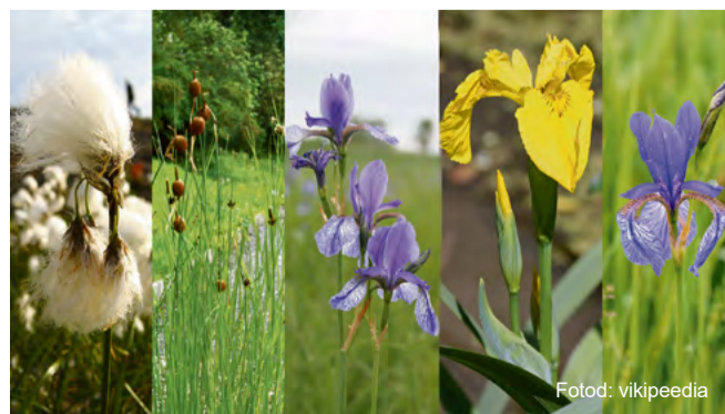
Villpea, hundinui ja erinevad iirised.