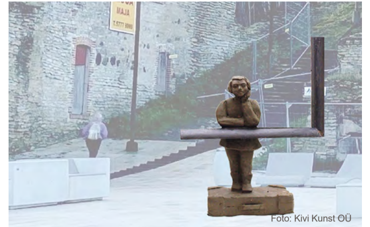
Skulptuurikonkursi võidutöö makett.

Meil on perefirma Kivi Kunst OÜ. Abikaasa on kiviraidur, meil on üks kivitöököda. Minul on kolm ruumi, kus on ateljee. Seal ma ka modelleerin ja teen selle töö valmis.