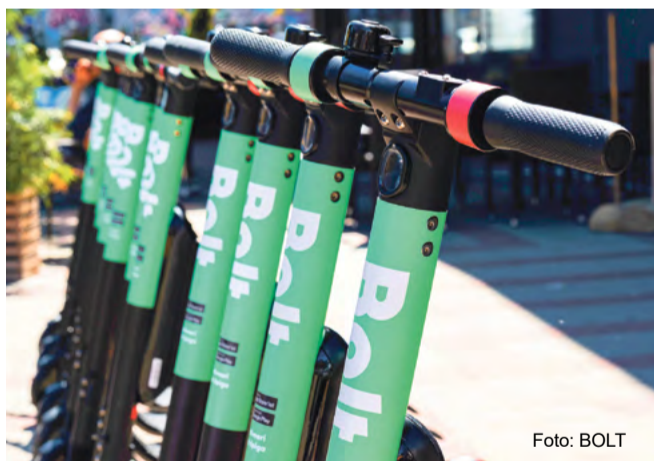
Rakveres on 12 Bolti tõukerataste parkimispunkti.