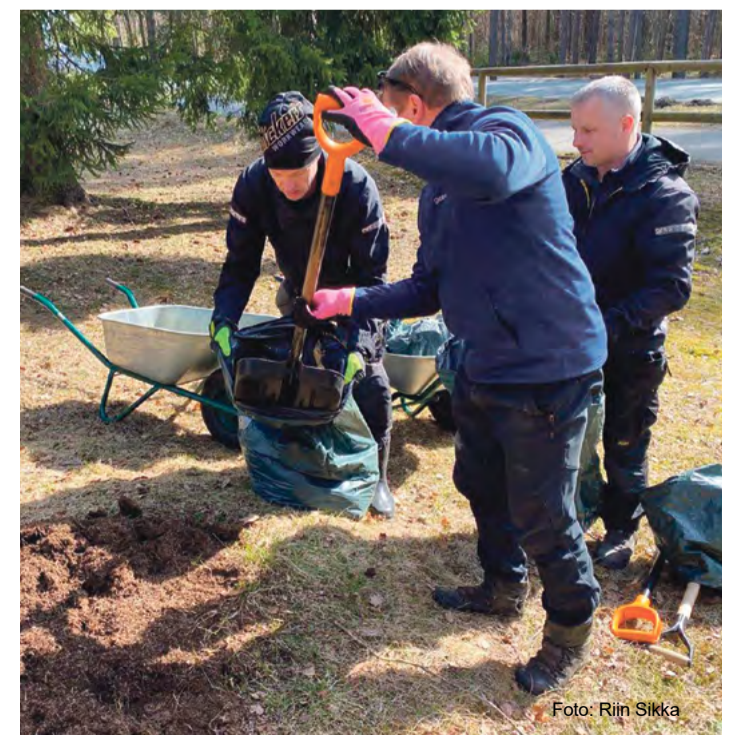
Kuklaste pesa teisaldamine.

Pärast pesade teisaldamist jälgitakse, kas endistesse pesakohtadesse on tekkinud uued pesamoodustised. Vajadusel teisaldatakse ka need, sest muidu ehitavad sipelgad uued pesad asemele.