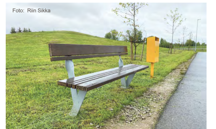
Linnaruumi paigaldatakse uusi pinke ja prügikaste.

„Paigaldame uusi prügikaste kohtadesse, kus neid varem ei olnud ja vajadus prügikasti järele suur. Samuti vahetame välja vanu ja väsinud prügikaste,“ lisas keskkonnaspetsialist.