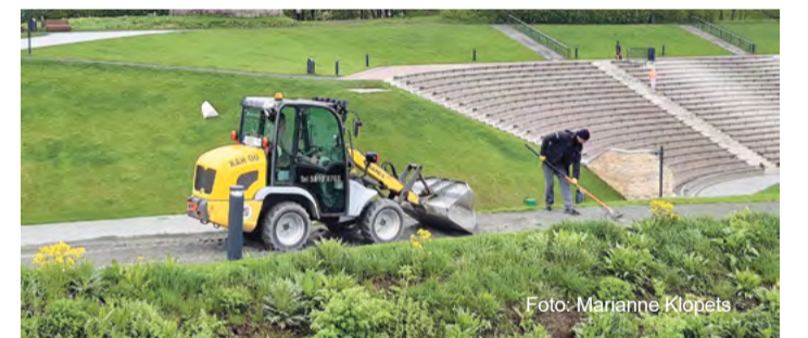
Vallimäe vabaõhukeskuse jalgteede korrastamine.

Tööde tegemise ajal külastajatele vabaõhukeskuse alal liikumispüüranguid ei kehtestata.