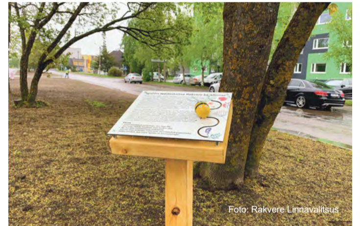
Niiduala infotahvlid tutvustavad mõtteviisi „Igaühe looduskaitse“.

Loodushoid ja roheline mõtlemine on meie tulevik ja loodetavasti saab Tuleviku tänavast tõeline Rakvere tuleviku tänav!