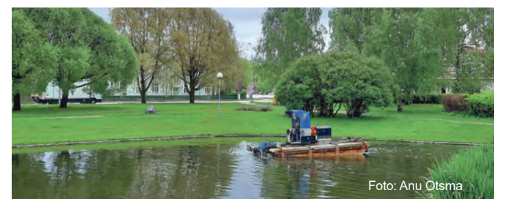
Tiigi puhastamine Kirikupargis.