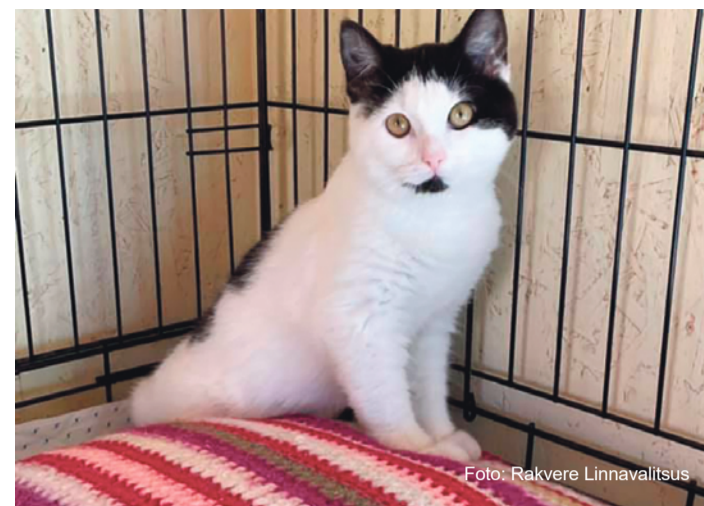
Kodu otsib 4-5 kuune kiibistatud ja vaktsineeritud emane kass.

Varjupaiga külastamine palutakse eelnevalt kokku leppida telefonidel 5303 0364 või 53008373. Varjupaik asub Rakveres Kasarmu tn 3.