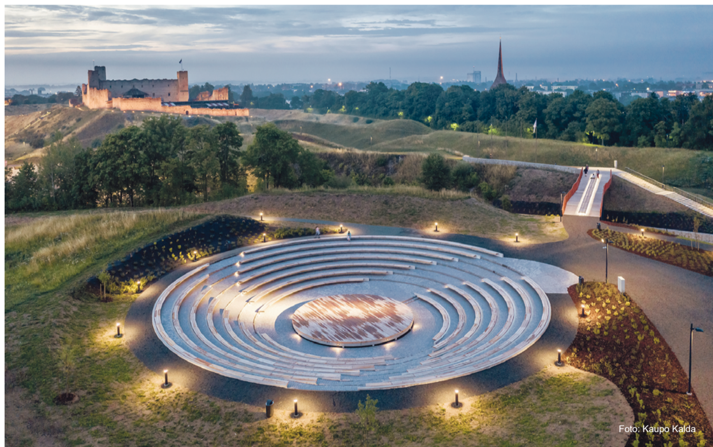
Rakvere Vallimäe ringlava.