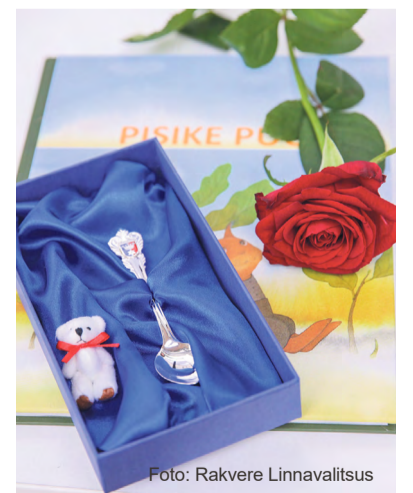
Kingitused noorimatele linnakodanikele.

Kes ei saanud lusikapeol osaleda, saab kingituse kätte Rakvere Linnavalitsuse sekretäritelt aadressilt Lai tn 20. Palume tuleku eelnevalt kokku leppida telefonil 322 5870.