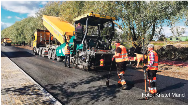
Jaama tänavas asfalteerimine.