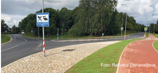
Tammiku-Öie tänav ristmik.