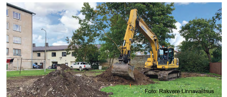
Ettevalmistavad tööd uue mänguväljaku rajamiseks.

Mänguväljaku ehitab peatöövõtjana OÜ Atix. Ehitus valmib lepingu järgi novembri alguses.