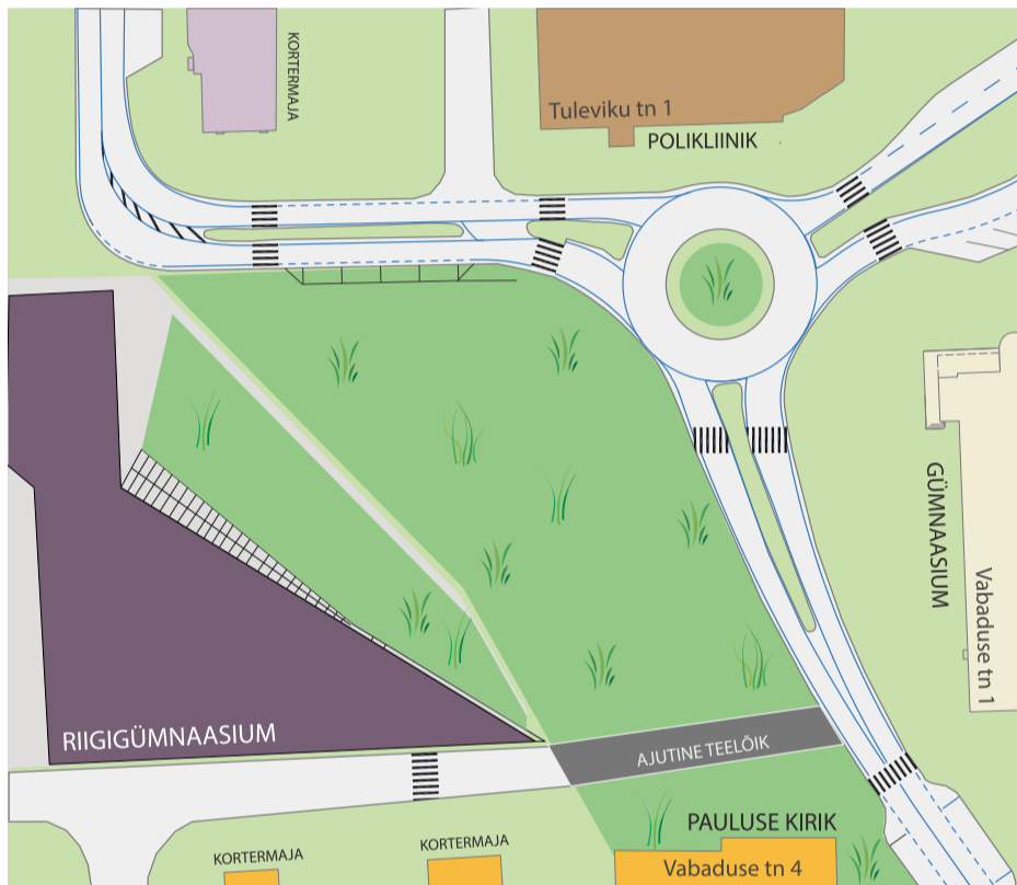
Rakvere Vabaduse tänava ringtee skeemi illustatsioon. Visuaal: Rakvere Linnavalitsus.

Linnavalitsus palub elanikelt mõistvat suhtumist ja palub vabandust ebamugavuste pärast.