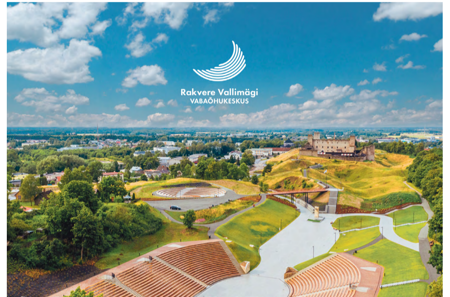
Rakvere vallimäe logo fotol. Logo autor Kuldar Leement.

Konkursi võidutöö autor Kuldar Leement rääkis, et kuna Vallimäe vabaõhukeskuse asetseb väga ajaloolises paigas, katsetati algselt erinevaid versioone nii linnusega kui ilma, aga seda kõike tundus olevat ühe logo jaoks liiga palju. "Siis saigi lähemalt uuritud keskuse jooniseid, kust vastu vaatas tugev, aga lihtne element, mida kasutasin logo arendamisel. Valitud element tundus hea, kuna soovisin logos näidata Vallimäe ja sellel asuva linnuse ajalugu, mis on olnud kihiline ja keeruline. Samas selline "kaitsekihtide" rõngas meenutab ka kaitsemüüre," jutustas autor.