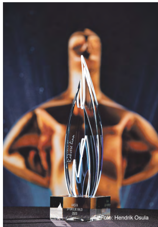
Spordiaasta tähtede galal üle antud tunnustus.

3. Loodan näha 10 aasta pärast aina rohkem lapsi seotud erinevate spordiorganisatsioonide ja spordiklubidega ja mitte kõik ei pea tegelema saavutus-spordiga. Samuti usun, et paranevad meie tervise-spordivõimalused ning linnaosadesse tekib linlastele mõeldud erinevaid vabaõhu spordiobjekte.