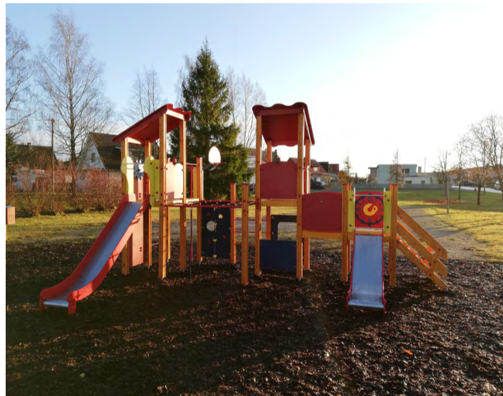
Korrestatud mänguväljak Vahtra tänaval.

Vahtra tänava mänguväljakule paigaldati uus mängulinnak ja kahekohaline kiik. Põhja tänava väljak sai mängulinnaku ja vedrukiige. Laial tänaval asuvale väljakule lisandus mängulinnak, kahekohaline kiik ja vedrukiik.