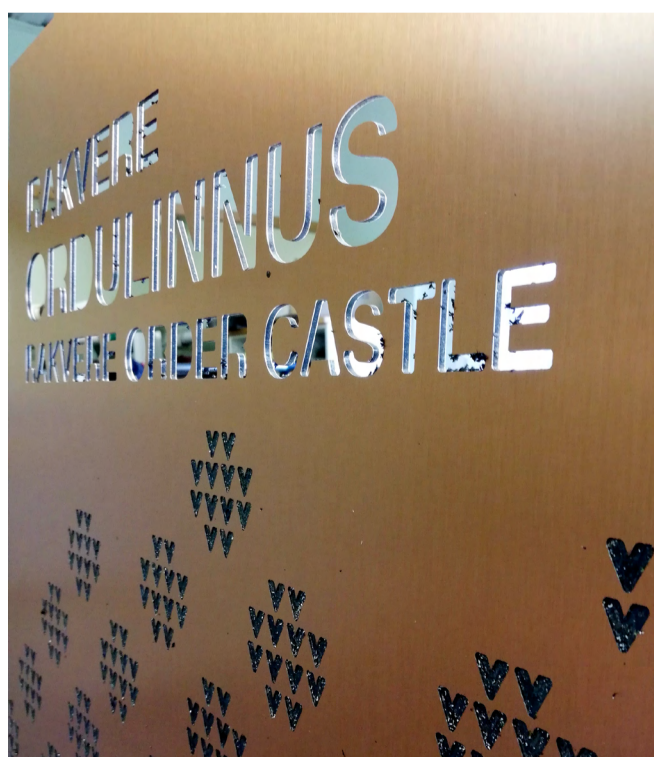
Valmimas on uus infotahvel.

Pikemas plaanis on kaasajastada ka teised Rakvere tutvustavaid infotahvleid.