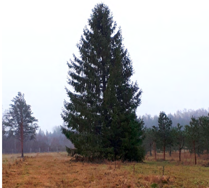
RMK kingitud kuusk Rakvere linnale.