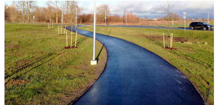
Vaala keskuseni viiv kergliiklustee.