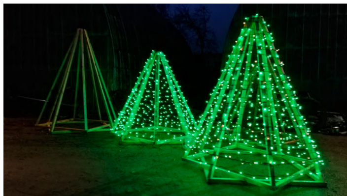
Valguslahendus Rakvere keskväljakul.