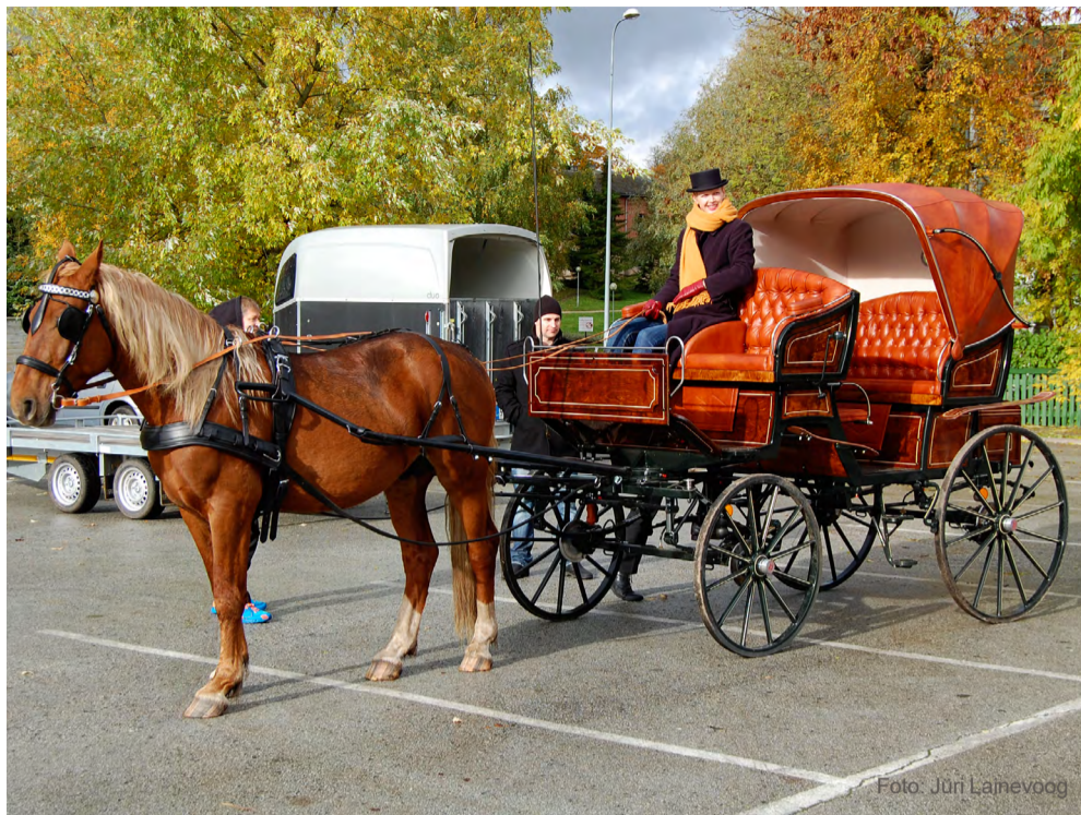
Kulina Mõisa hobukaless.

laia ilma rännanud, sätivad oma küllastuse just sellele ajale. Ka ettevõteted võiksid Rakvere jõuluküla oma aastaplaani märkida ning midagi toredat välja mõelda. Anname ka oma perega ürituse õnnestumisse panuse ja toome linnarahva meelt lahutama kuljustega hobusõiduki. Kalessi paneb veerema meie tubli tori tõugu täkk Hurmur. Meie talvedega on nii, et saanisõiduks tihti lund ei jagu ja seepärast on ratastega sõiduk kindla peale minek. Kui varasemalt sõideti Keskväljakust installatsiooni uurides mööda, siis jõuluküla on kindlasti selline koht, mis kutsub autost välja astuma ja koha peal uudistama. Jõulud on aeg, mil tahetakse olla koos lähedaste, sõprade ja perega. Rakvere jõuluküla võiks olla neile veel üheks kohtumiskohaks. Ilusat jõuluoostust kõikidele! Kohtume Rakvere Keskväljakul!“