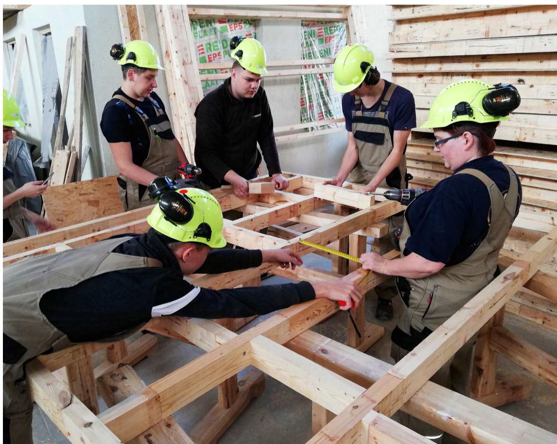
Rakvere Ametikooli esimese kursuse puitkonstruktsioonide ehituse eriala õpilased jõuluküla maju ehitamas.