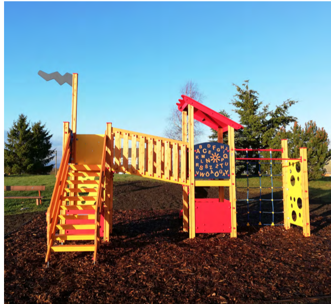
Põhja tänava mänguväljak Moonakülas.