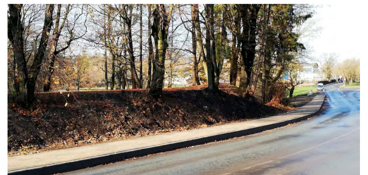
Kõnnitee Kastani puiesteele Aqva spordihalli ja silla vahelisel lõigul.