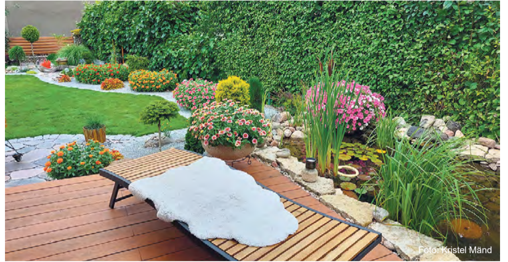
Parima eraaia tiitli pälvis Õie tn 42 kinnistu.

Lühikirjelduse koos kinnistu aadressi ning omanike nimede ja kontaktidega palume saata e-posti aadressile kart-mari.paju@rakvere.ee või linnavalitsus@rakvere.ee märksõnaga „Rakvere kaunis kodu 2024“.