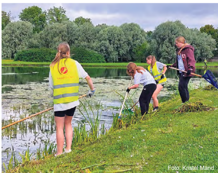
Malevaled tööhoo Vabriku tänaval Rahvaia tiigi ääres.