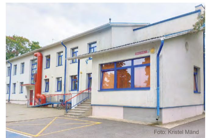
Rakvere Sotsiaalkeskus asub aadressil E. Vilde tänav 2a.