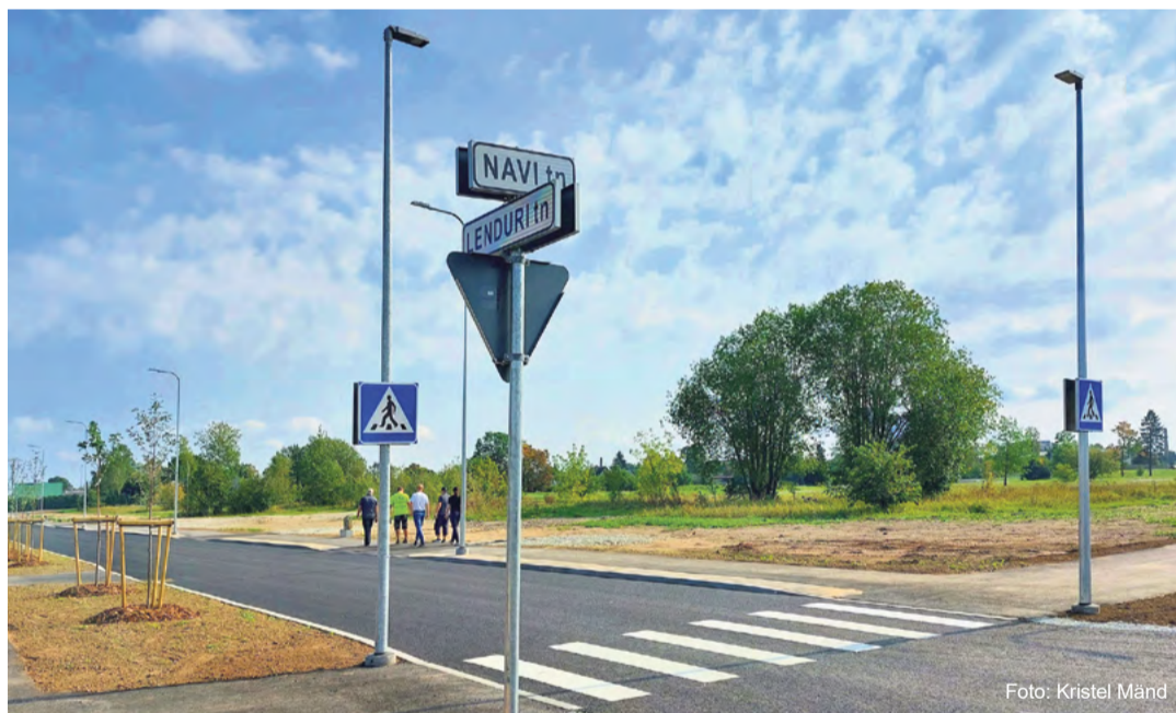
Navi tänava elamuarendus.

Karus lisas, et uuel aastal on ka juba konkreetsed mõtted järgmise elamuarenduse detailplaneeringu osas, millega hakatakse tegelema 2024. aasta I kvartalis.