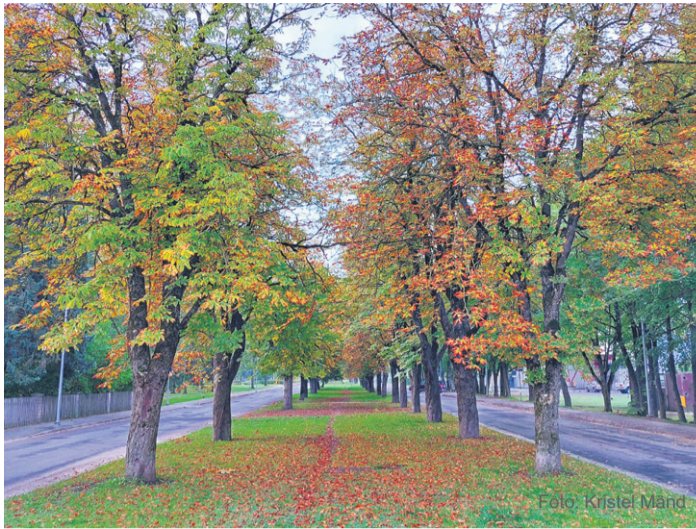
Kastani alleest on alles vaid pool.

Teine probleem ja Kastani puistee allee traagika seisneb dendroloogi sõnul hobukastanite pindmises hargnevas juurestikus ja nende kahjustustes teehituste või soolatamise tõttu. Täna varase-