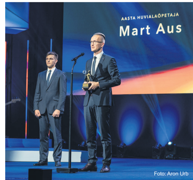
Aasta õpetaja gala 2023.

Kõik laureaadiid said traditsiooniliselt auhinnaks väikesel Joosepi kuu, kes hoiab käes maakera, mis sümboliseerib kogu maailma teadmisi.