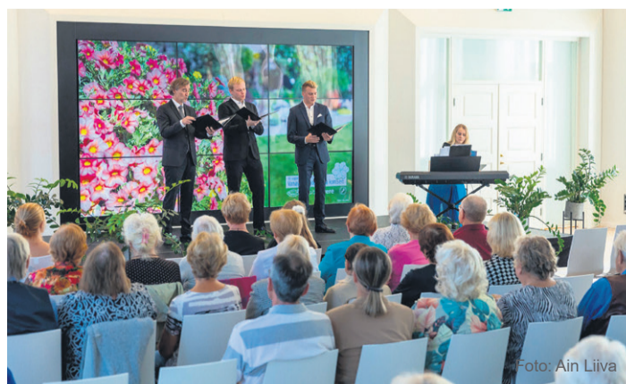
Vanavanemate päeva kontsert 10. septembril 2023.