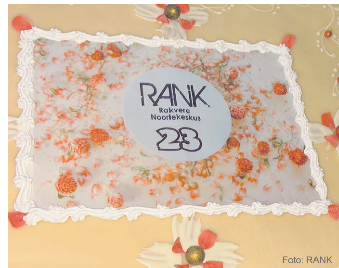
Sünnipäevalaul oli ka väga maitsev tort.