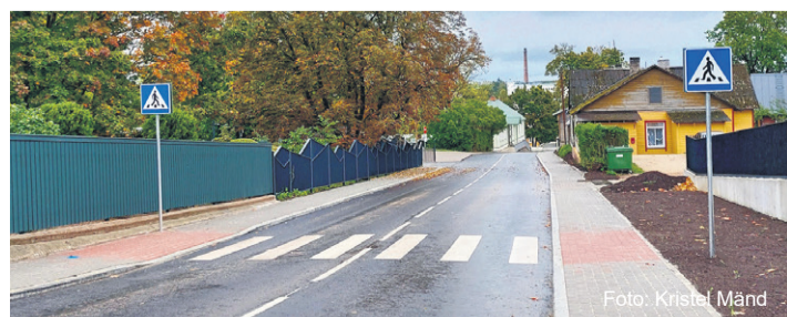
Vaade remonditud Tõusu tänavale.

Navi tänava elamuarenduse puhul on tegemist Rakvere linna ajaloos esimese ja suurima taolise projektiga. Välja ehitati kogu va-