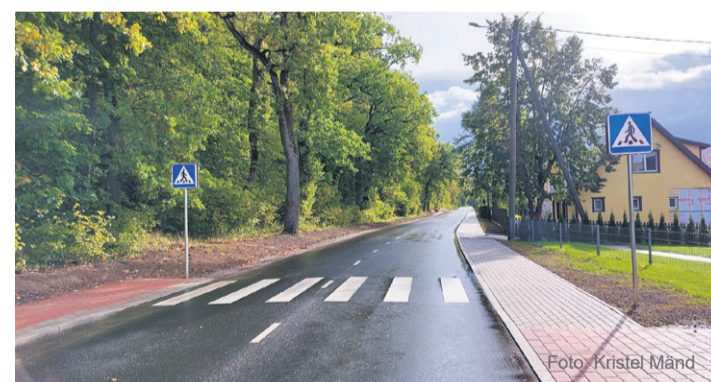
Vaade värskest renoveeritud Õie tänavale.

kasvanud väga suureks. Seetõttu on oluline pöörata senisest rohkem rõhku ja ressursi teedeehitusele. Järgmisel aastal on ühe objektina kindlasti kavas rekonstrueerida kehvas seisus Kastani puistee,“ rääkis Karus tulevikuplaanidest.