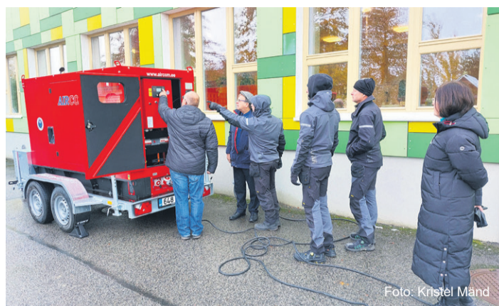
Generaatori testimine Rohuaia lasteaias.

Testimine sujus edukalt. „Ühel juhul ilmnes väike ebakõla, mille saime katsetamise käigus kohe likvideerida. Järgmisel korral enam probleemi pole,“ ütles ta.