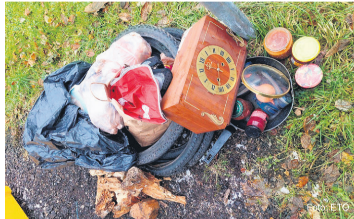
Rakvere linna avalikest pakendikonteineritest leitud valeid jäätmed, sh köis, moosipurgid, pann, taimejäänused, riided, toidujätmed jne.