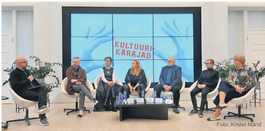
Kultuurikäräjatel said kaasa mõelda kõik huvilised.

Rakvere Kultuurikeskuse jaoks on au- ja südameasi luua Arvo Pärdi nimelisele muusikamajale väarikas sisu. Maestro on usaldanud meile kõigile oma nime kasutuse nii valmival muusikamajal, kui ka tänava juba neljandat korda toimival Rakvere Kultuurifestiivalil. See seab meile kõrgemad eesmärgid ning sunnib lisapingutusteks. Muusikamaja käivitamiseks on väljatöötamisel ühine tegevus- ja turundusplaan, planeeritud on mitmeid võrgustiku kohtumisi ning kaasamisi. Samm-sammult ja kindlalt liigume edasi, et Arvo Pärdi nimelise muusikamaja programmiga publikult juba õige pea rõõmustada.