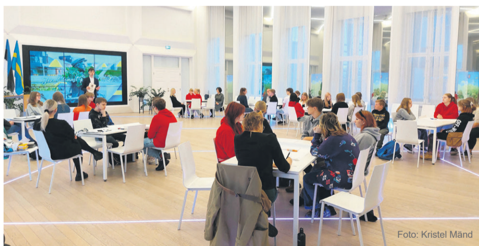
Noored pakkusid välja palju ideid, kuidas linnaelu edendada.