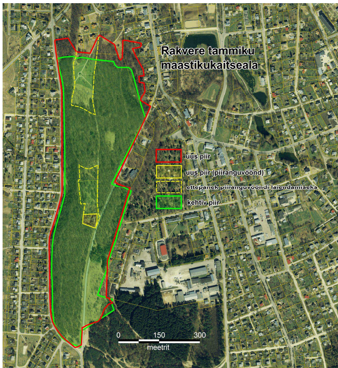
Rakvere tammiku MKA kehtiv piir, KE eelnõu ettepanek ja Ekspertiisi ettepanek piiranguvööndi laienduse osas.