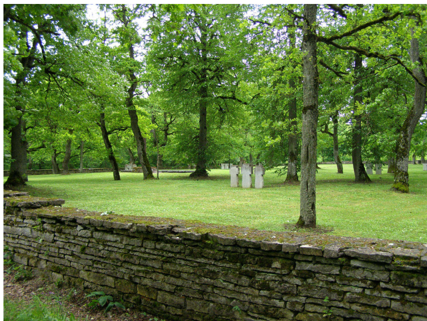
Sõjaväekalmistu. Pigem piirangu- kui sihtkaitsevöönd

Uus piiranguvööndi kontuur järgib teede ja kõlvikute piire (vt. joonis ↓). Sihtkaitsevööndi ja piiranguvööndi eristamist maastikul (tähisted) vaja ei ole. Tammiku tavakasutajad ei kujuta endast sihtkaitsevööndile mingit ohtu. Võimalikul loa taotlejal (rahvaüritus?) on jälle aega, et eeltöö korras end pargiala tsoneeringuga kurssi viia.